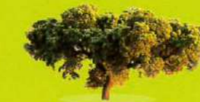
Encina ( Quercus ilex )