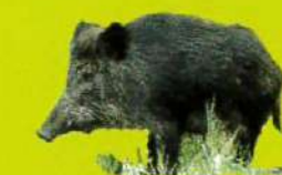
Jabalí ( Sus scrofa )